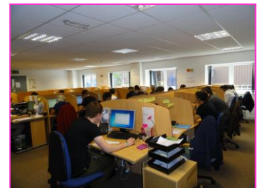
Située au rez-de-chaussée de nos bureaux